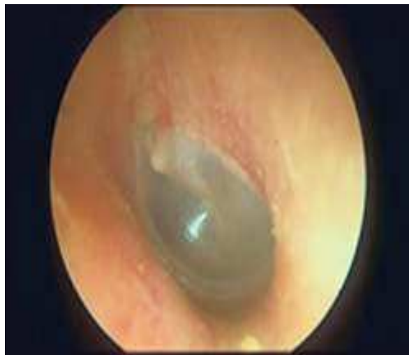
Membrana timpanica normale

Tra le otiti esterne di origine virale va menzionata quella da Herpes Virus (può insorgere in corso di Varicella), in genere molto dolorosa, con tendenza a complicarsi in otite media e, nei casi gravi, quando soprattutto colpisce soggetti particolarmente predisposti o immunodepressi, dare vita a paralisi del Nervo facciale e sordità.